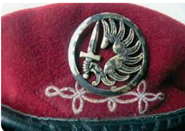
Béret parachutiste et sa « hongroise ».