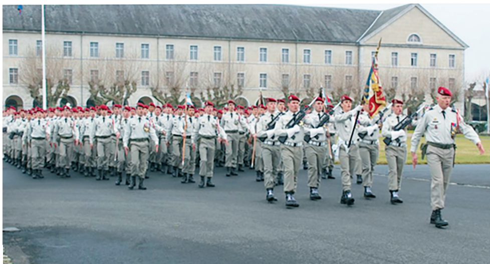
Défilé du 1er RHP.