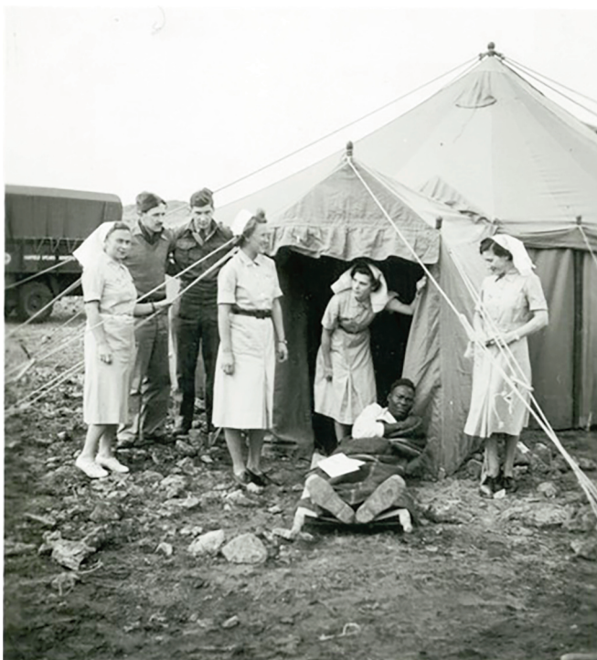
Infirmières Volontaires françaises soignant un blessé.

de devenir le Corps des volontaires françaises. Le personnel féminin suit alors les mêmes formations que leurs homologues britanniques de l'« Auxiliary Territorial Service » (ATS). Dans cette dynamique, les FFL offrent aux femmes, à partir de mai 1941, une formation de mécaniciennes d'avion