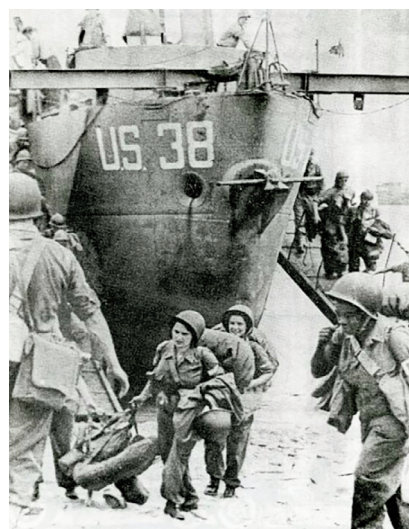
Volontaires françaises lors du débarquement de Provence, 15 août 1944

combat qui suscite crainte et méfiance des autorités. Ce n'est pas tant leur «vulnérabilité » qui inquiète le commandement que la proximité inévitable entre personnels masculins et féminins, perçue comme une source potentielle de désordre disciplinaire et moral : « La présence de ces femmes, d'origine très diverse, trop enclines à considérer la guerre comme du camping, amène des perturbations du point de vue disciplinaire ». De plus, la figure de la « combattante » est perçue comme une menace pour l'image traditionnelle et conservatrice des femmes. Son rapprochement avec celle de la prostituée nourrit l'imaginaire collectif. Cette inquiétude transparaît dans les discours officiels et dans les règlements. Enfin, les conditions de vie dans les zones de combats achèvent de déconstruire les représentations « habituelles » de la féminité. Nombre de cadres redoutent que les dures réalités du terrain ne compromettent les « qualités » supposées naturelles des femmes : élégance, distinction, retenue et leur place dans la société. Dans ses directives, le général de Lattre de Tassigny rappelle aux femmes de la première armée leur devoir de « décence » tempéré de « coquetterie ». Mais dans les faits, les ambulancières, équipées de paquetages américains conçus pour des hommes, privées d'eau et d'intimité, apparaissent sou-