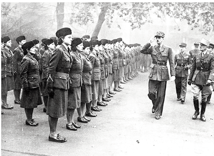
Revue des Volontaires françaises par le général de Gaulle, fin 1944.

Les semaines qui suivent, plusieurs dizaines d'ambulancières débarquent en Provence à bord de « half-tracks » transformés en véhicules sanitaires. Elles font partie des 2.000 femmes militaires engagées dans la Première Armée. Le parcours de ces femmes est très varié. Certaines sont des Françaises libres venues de Londres, d'autres ont rejoint les rangs depuis l'AFN, certaines viennent des Forces françaises de l'intérieur (FFI), quand d'autres, issues de la Croix-Rouge, intègrent les troupes régulières au fur et à mesure de la libération du territoire. Sans être armées, elles se retrouvent exposées aux mêmes dangers que les