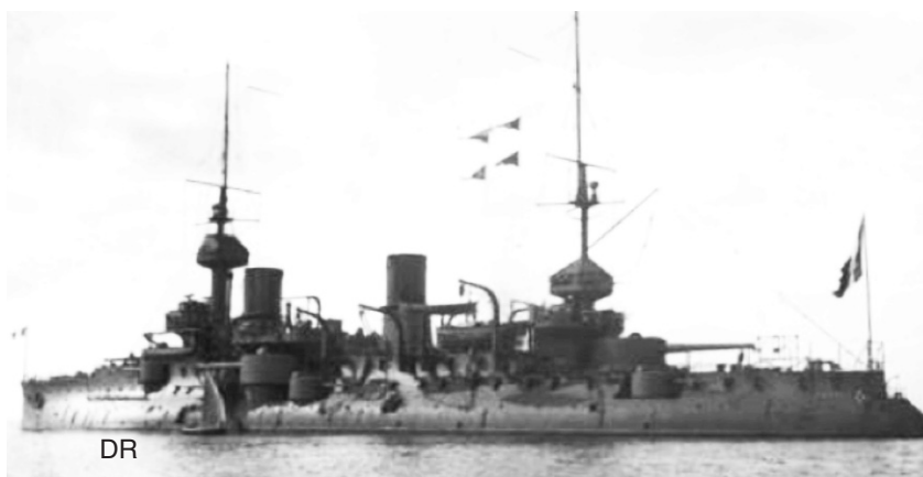
Le cuirassé Bouvet.

Dans la Manche et en mer du Nord, les destroyers français de Cherbourg réussirent plus d'une fois à retarder l'avance allemande le long de la côte belge. Mais ce fut surtout la lutte anti-sous-marine qui occupa les bâtiments français y compris en Atlantique. Les moyens faisaient cruellement défaut au début de la guerre. Il fallut commander, en 1916, des navires supplémentaires au Japon et en Grande-Bretagne. Lorsque l'Allemagne déclara la lutte anti-sous-marine à outrance, en février 1917, leur mise en place permit à la France de participer activement aux côtés des Britanniques et des Américains à la guerre contre les sous-marins.