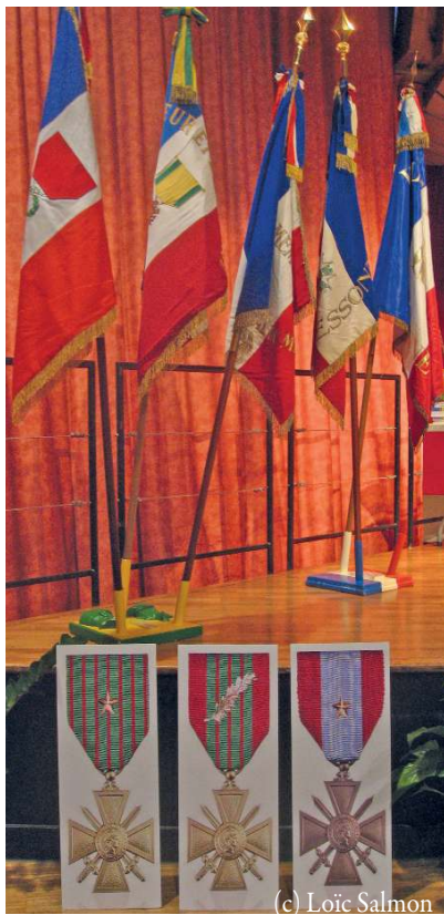
Les trois croix de Guerre : de gauche à droite, 1914-1918, 1939-1945 et théâtres d'opérations extérieurs